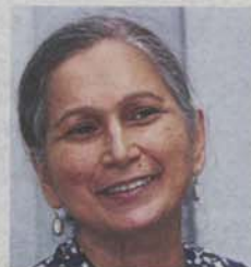
Leela: The new degazettement proposal goes against the Selangor Structure Plan 2035 to maintain 32% of areas as forest reserves.

government is holding a public hearing prior to the degazettement of forest reserve since the Public Inquiry (Selangor) Rules 2014 was put in place.