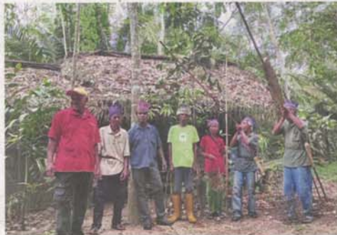
Some 2,000 Temuan Orang Asli rely on the Kuala Langat North Forest Reserve for their livelihood.

"After rebuilding their lives, now there is a threat that can take