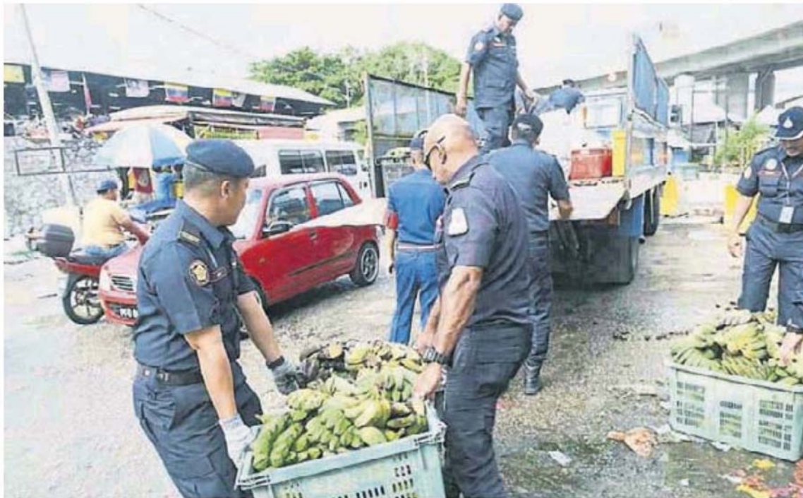
执法人员充公非法小贩的货品，把货品搬上车。