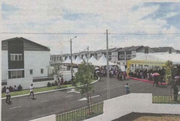
A total of 987 settlers received their keys to Laman Haris in Bandar Puncak Alam which was developed by Eco World Development Group Bhd.