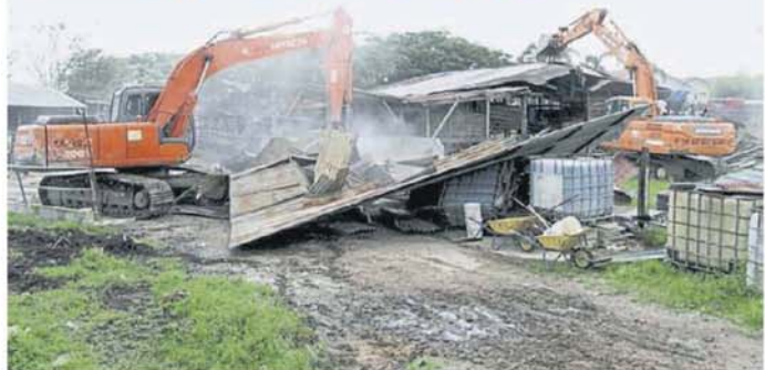
■在牛羊群离开后,执法人员以神手展开拆除工作。