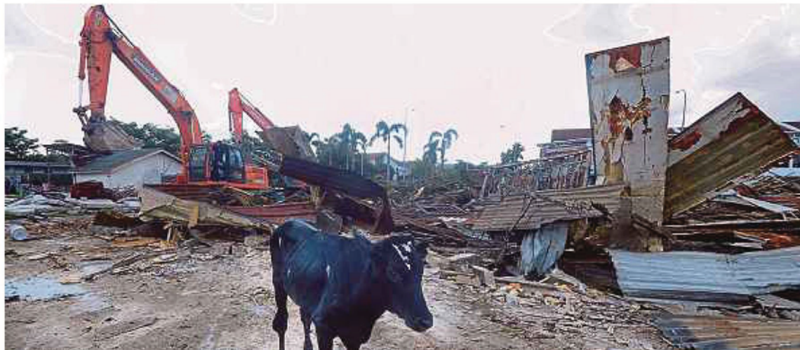
Jentera berat merobuhkan kandang haram di tanah rizab masjid dan sungai di Bandar Botanik, Klang, semalam.