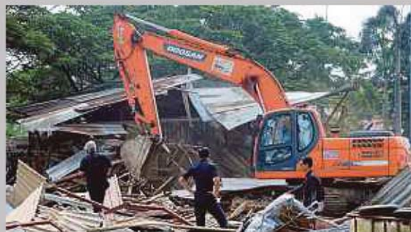
JENTERA digunakan bagi merobohkan kandang lembu dan kambing yang dibina di tanah yang dikategori rizab masjid dan rizab sungai di Bandar Botanic, Klang. - Bernama

“Notis pencerobohan dihantar kepada pemilik struktur pada 13 November 2006, 7 Oktober 2017 dan 9 Januari lalu supaya mereka mengosongkan tapak berkenaan, namun tidak diendahkan,” katanya. - Bernama