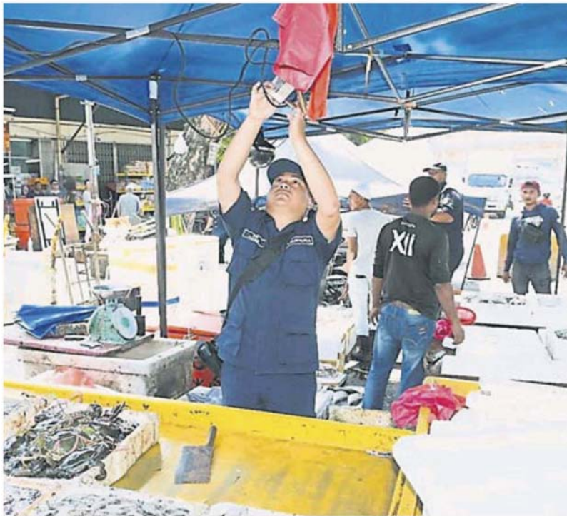
执法人员拆除非法小贩的档口。

(士拉央 17 日讯) 士拉央市议会日前展开特别联合大取缔，充公了 14 名非法小贩的货品！