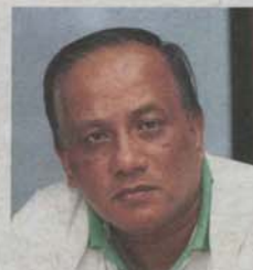
Balu: There is nowhere else in Selangor with peat swamps like the one at Kuala Langat North.