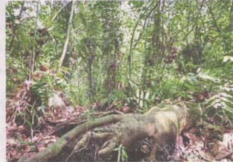
The Kuala Langat North Forest Reserve is estimated to be about 8,000 years old.

"For the people, the department is seen as a protector of the forest but now it acts as a businessman who allows the forest to be degazetted with the aim of developing it and having a major sand mining pit," he said.