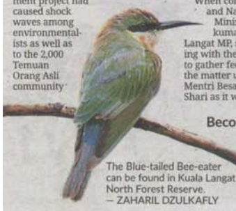
The Blue-tailed Bee-eater can be found in Kuala Langat North Forest Reserve.

The notice that the forest could be degazetted for a mixed development project had caused shock waves among environmentalists as well as to the 2,000 Temuan Orang Asli community.