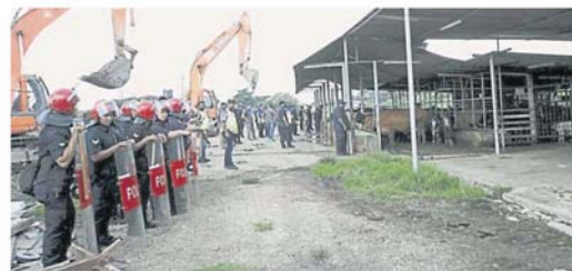
警方严正以待，派足警员防范，避免发生任何冲突。

据了解，该饲养场占据的地段目前正进行扩宽河流计划，以挖深和开拓双溪奥河支流，解决圣淘沙水患问题；此外，州政府也将于今年拨款，推展兴建华人回教堂工程。