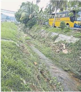
雨量过大，大沟无法负荷，加影流古路往加影第2城镇的隧道半年后再度淹水。

Provided for client's internal research purposes only. May not be further copied, distributed, sold or published in any form without the prior consent of the copyright owner.