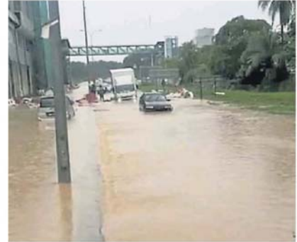
隧道淹水，往返加影和万宜的交通也被切断。

他说，隧道旁正进行电动火车站工程，泥浆由公共工程局和电动火车站承包商负责清理，另外，公共工程局将在本周召开会议讨论。