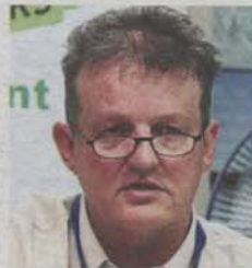
Faizal: If the development of KLNFR went ahead, it could release 5.5 million tonnes of carbon dioxide.