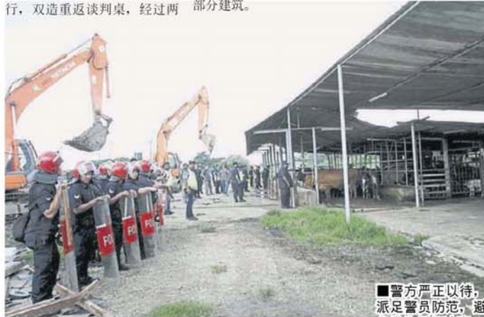
■警方严正以待,派足警员防范,避免发生任何冲突。

据了解,该饲养场占据的地段目前正进行拓宽河流计划,以挖深和开拓双溪奥河支流,解决圣淘沙水患问题;除此,州政府也将于今年拨款,推展兴建华人清真寺工程。