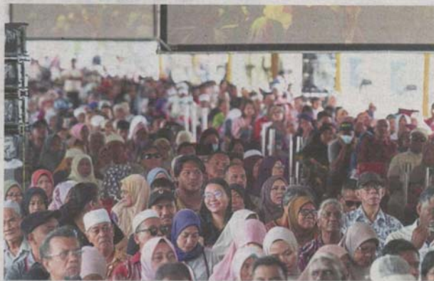
More than 1,500 attended the launch and key handover ceremony at Laman Haris.

settlers, landowners as well as the unwavering support of Azmin Ali, the former MB who enabled the project to be realised without compromising settlers' rights," said EcoWorld chairman Tan Sri Liew Kee Sin. Azmin said the state government had worked tirelessly on the project. "When I was the MB for Selangor, the project had already been abandoned and the settlers were neglected. "Now, they can finally enjoy comfortable homes," he said.