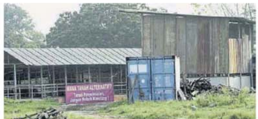
■当局拆除饲养场之前,业者曾拉横幅表达不满,反指对应的饲养场尚未建设好。