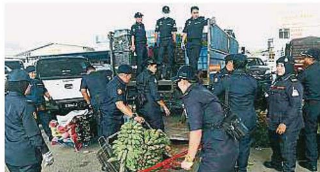
里。 非法小販物品，並將東西搬上非 士拉央市議會充公非