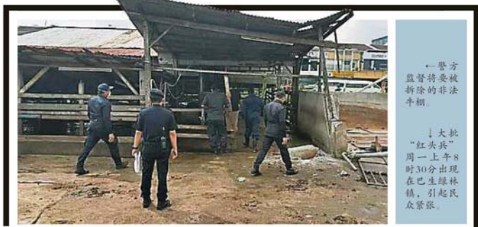
警方監督將要被拆除的非法牛棚。 大批“紅頭兵”周一上午8時30分出現在巴生綠林鎮，引起民眾緊張。