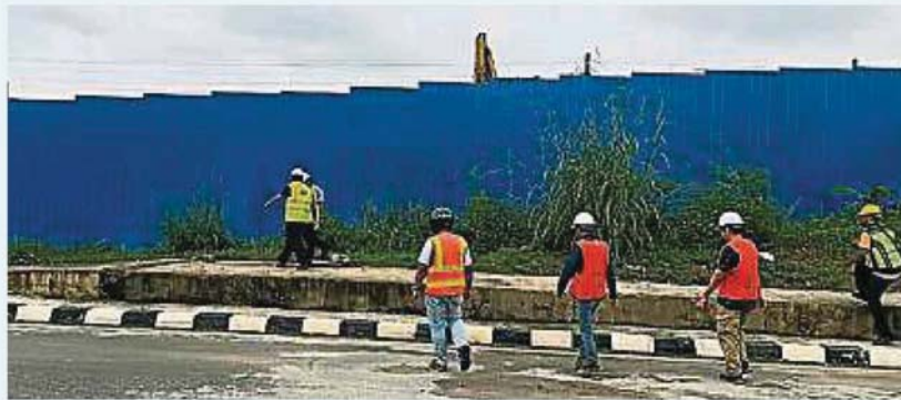
淹水现场，调查原因。 乌冷公共工程局官员视察。