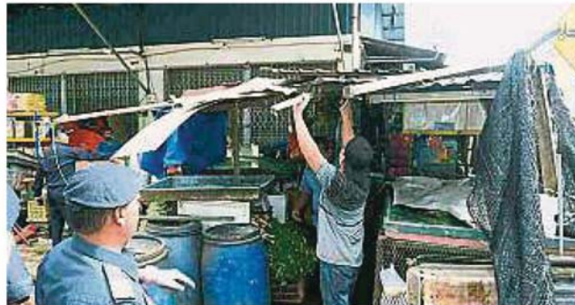
拆除非法攤位，十分狼狽。 非法小販在官員的監督下，

“我們提醒小販，不能在未獲批准情況下，在不允許經商的地点做生意，尤其是公共地區。還有，小販須向市議會申請營業執照。”