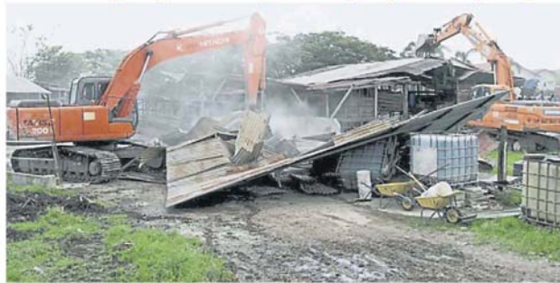
在牛羊群离开后，执法人员以神手展开拆除工作。